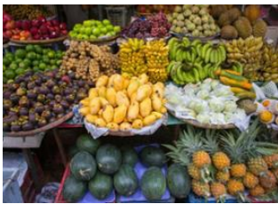
Luang Prabang 📍