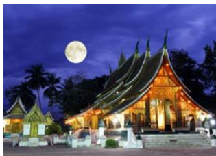
Luang Prabang 📍