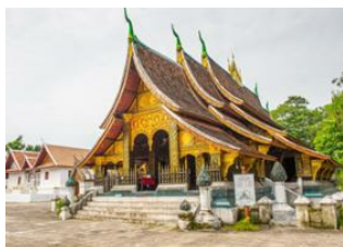
Luang Prabang 📍