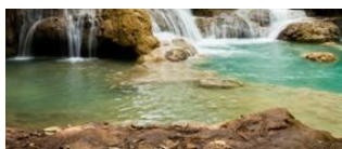
Luang Prabang 📍

visiterons sa petite exposition permanente axée sur la préservation des ours noirs d'Asie du sud-est menacés d'extinction.