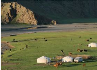
Khögnö Khan 📍