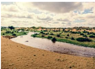
Oulan Bator 📍