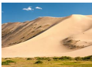
Bayanzag 📍 🚗 40km - ⌚ 1h Pétroglyphes de Khavtsgait 📍 🚗 160km - ⌚ 4h Dunes de khongor 📍