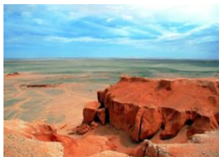
Monastère d'Ongii 📍 🚗 150km - ⌚ 4h 30m Bayanzag 📍