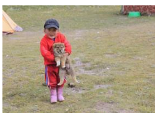
Camp N°2 Lenine 📍 12km - ⌚ 4h