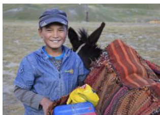
Achik-Tash Base Camp (3600 m) 📍