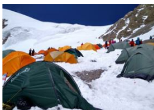
Camp N°2 Lenine 📍 - ⌚ 6h