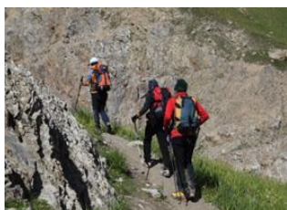
Achik-Tash Base Camp (3600 m) 📍 - ⌚ 6h Petrovsky Peak 📍 Achik-Tash Base Camp (3600 m) 📍