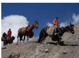
Achik-Tash Base Camp (3600 m) 📍 12km - ⌚ 6h Camp N°1 Lenine 📍