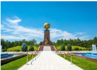
Boukhara 📍 🚗 600km - ⌚ 4h Tachkent 📍