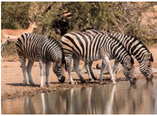
Blyde River Canyon Lodge 🚗 80km - ⌚ 1h 20m Timbavati