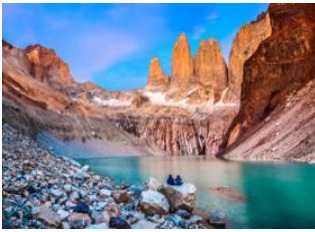
Complexe de Las Torres