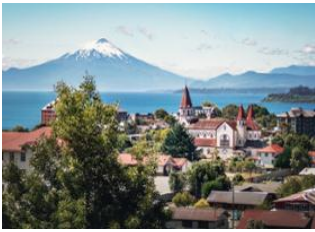
Puerto varas 📍