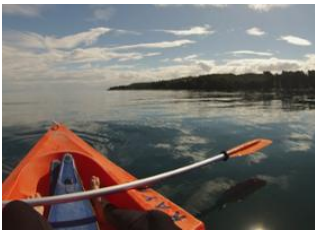
Puerto varas 📍