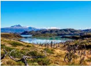
Parc National de Torres del Paine