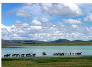
Monastère de Baldan bereeven 📍 🚗 250km - ⌚ 6h Gün Galuut 📍