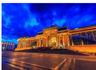
Gün Galuut 📍 🚗 130km - ⌚ 2h 30m Oulan Bator 📍