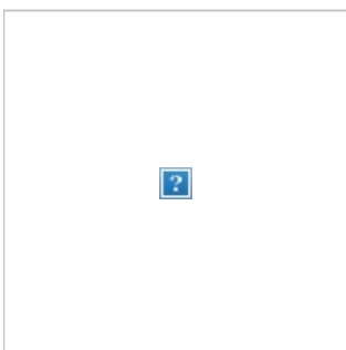
Lima 📍 ✈️ - ⌚ 1h 30m Arequipa 📍