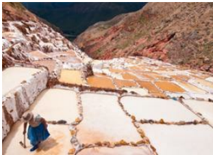
Cusco 🚗 80km - ⌚ 3h Ollantaytambo 🚗 - ⌚ 1h 30m Machu Picchu