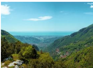
Massa 📍 23km - ⌚ 6h 30m Camaiore 📍