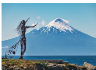
Puerto varas 📍