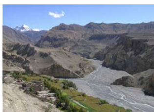
Chhuksang (2980 m) 📍