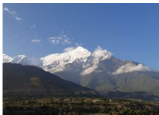
Jomsom (2720 m) 📍