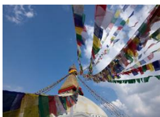
Katmandou (1330 m) 📍