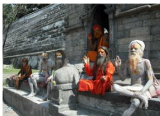
Katmandou (1330 m) 📍