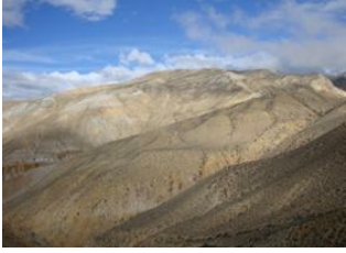
Samar (3600 m) 📍