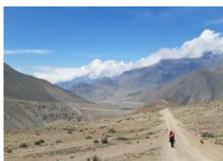
Muktinath (3700m) 📍