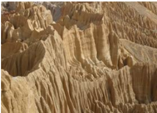
Geling (3570 m) 📍