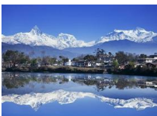
Pokhara (820 m) 📍