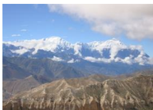
Tange (3344 m) 📍