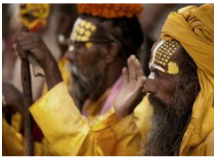
Katmandou (1330 m) 📍