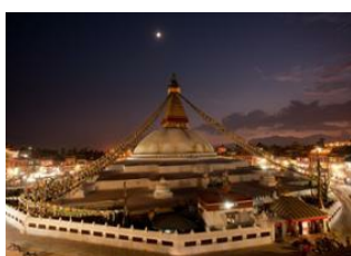
Katmandou (1330 m) 📍