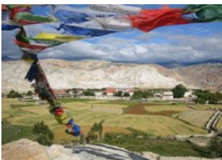
Lo Manthang (3840 m) 📍