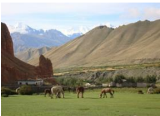
Dhakmar (3730 m) 📍