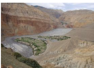
Chhuksang (1330 m) 📍