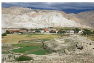
Lo Manthang (3840 m) 📍