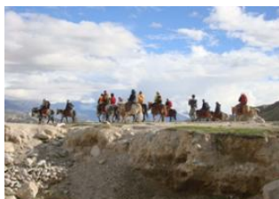
Yara (3600 m) 📍