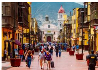
Puerto Maldonado 📍