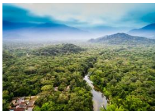
Puerto Maldonado 📍