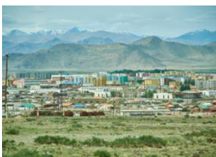
Oulan Bator 📍 ✈️ 1500km - ⌚ 1h 30m Khovd 📍