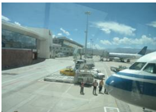
Katmandou (1330 m) 📍 ✈️ 650km - ⌚ 1h 20m Lhasa (3650 m) 📍