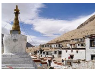
Shigatse (3900 m) ↴ 🚗 340km - ⌚ 7h 30m Rongbuk (5000 m) ↴