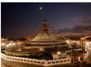
Katmandou (1330 m) 📍