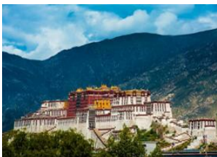
Lhasa (3650 m) 📍