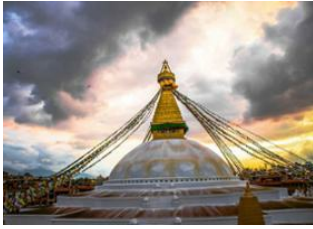
Katmandou (1330 m) 📍