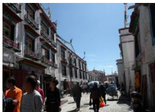
Lhasa (3650 m) ↴