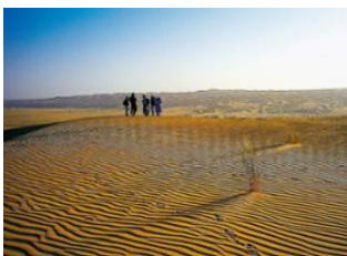
Tin Demane 📍 20km - ⌚ 7h Erg Tafoujert 📍 20km - ⌚ 6h Aouinet Et Tiliski 📍