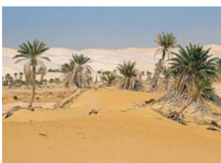
Aouinet Et Tiliski 📍 25km - ⌚ 10h 40m Telaghza 📍 17km - ⌚ 5h Aïn El Khadra 📍