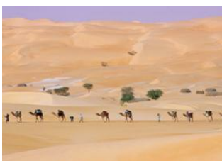
Lagueïla 📍 20km - ⌚ 6h