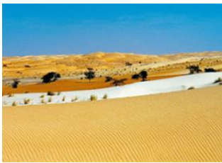
Chinguetti 📍 10km - ⌚ 3h Lagueïla 📍