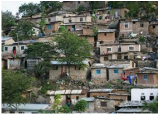
Lake Victoria 📍 🚗 180km - ⌚ 4h Mwanza 📍