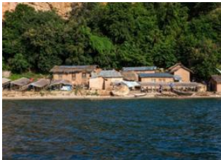
Mwanza 📍 🚗 270km - ⌚ 7h Kigoma 📍