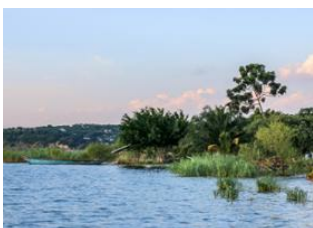
Kigoma 📍 🚗 330km - ⌚ 7h Kigoma 📍