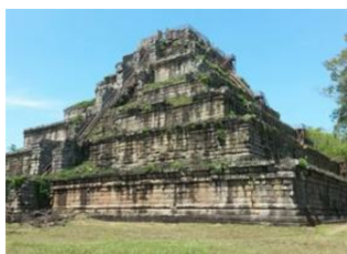
Preah Vihear 📍 🚗 165km - ⌚ 3h Siem Reap 📍