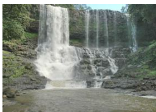
Kratie 🚗 230km - ⌚ 4h Sen Monorom