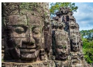
Siem Reap 📍

7km Angkor Wat 📍 3km Les Temples d'Angkor 📍 Siem Reap 📍