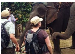
Sen Monorom 🚗 Sen Monorom