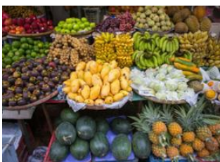
Luang Prabang 📍