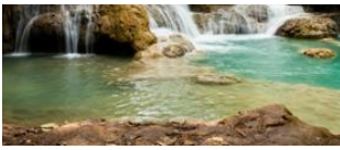
Luang Prabang 📍

visiterons sa petite exposition permanente axée sur la préservation des ours noirs d'Asie du sud-est menacés d'extinction.