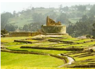
Cuenca 📍 🚗 215km - ⌚ 4h Guamote 📍