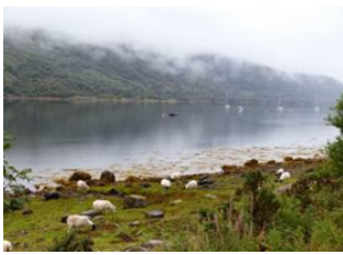
Fort William 📍