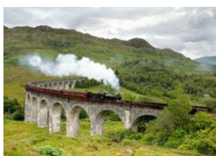
Fort William 📍