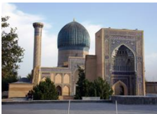
Guijdouan 📍 🚗 270km - ⌚ 4h Samarcande 📍