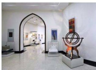
Samarcande 📍 🚗 300km - ⌚ 2h 15m Tachkent 📍