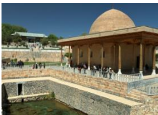
Boukhara 📍 🚗 240km Guijdouan 📍