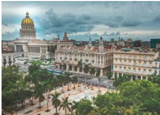
La Havane 📍