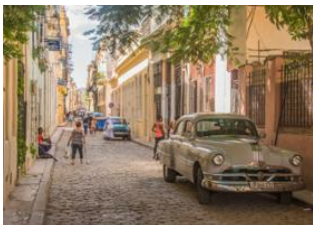
La Havane 📍