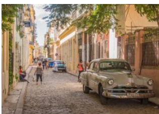
La Havane 📍