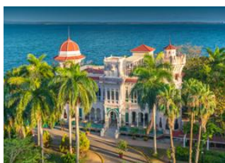
Ciénaga de Zapata 📍 🚗 200km - ⌚ 3h Trinidad 📍