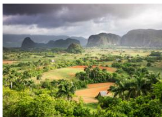
La Havane 📍