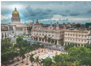
La Havane 📍