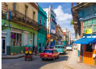
La Havane 📍