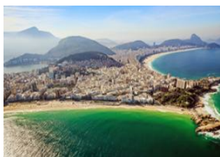
Rio de Janeiro 📍