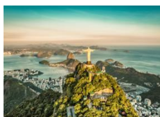
Rio de Janeiro 📍