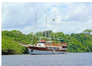
Manaus 📍 🚣 Amazonie 📍