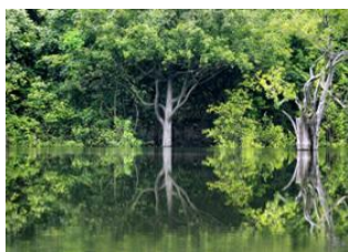
Rio de Janeiro 📍 ✈️ - 🕒 4h Manaus 📍