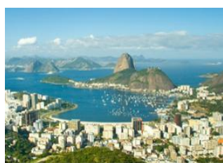
Rio de Janeiro 📍