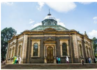
Addis - Abeba 📍