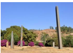
Addis- Abeba 📍