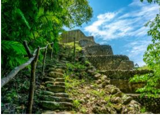
San Ignacio 📍