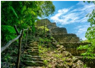
San Ignacio 📍