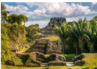
San Ignacio 📍