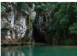
San Ignacio 📍