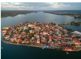
San Ignacio 📍