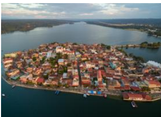
San Ignacio 📍