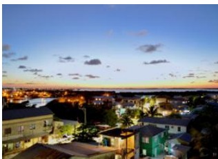
Belize City 📍