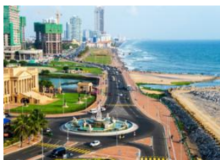
Kandy 📍 🚗 - ⌚ 2h 45m Colombo 📍