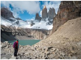
Parc National de Torres del Paine