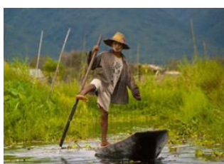
Lac Inle 📍