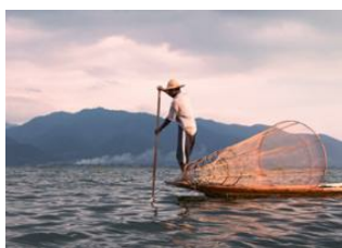
Lac Inle 📍

• La journée est consacrée à la découverte en pirogue du lac Inle , de ses habitants et de ses activités. À 1200m d'altitude, jouissant d'un climat agréable et entouré de collines verdoyantes, le cadre est idyllique . L'ethnie Intha vit sur le lac dans des maisons sur pilotis et cultive fruits et légumes dans des jardins flottants .