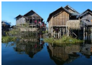
Lac Inle 📍