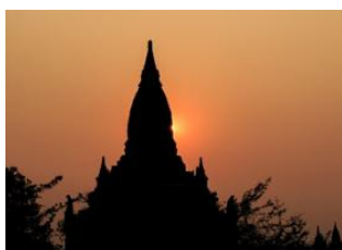
Lac Inle 📍