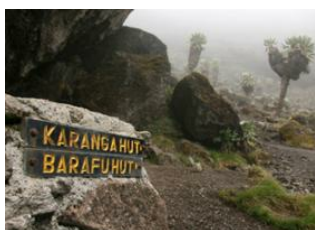
Barranco Hut (3 800 m) ▼ - ☉ 7h Barafu Hut (4 600 m) ▼