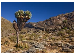
Shira Hut (3 800 m) ▼ - ☉ 6h Barranco Hut (3 800 m) ▼