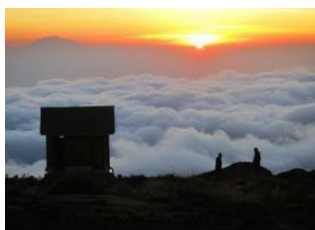
Machame Hut ▼ - ☉ 5h Shira Hut (3 800 m) ▼