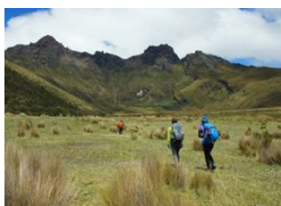
Machachi 📍 Laguna Limpiopungo 📍